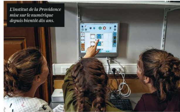
L'institut de la Providence mise sur le numérique depuis bientôt dix ans.