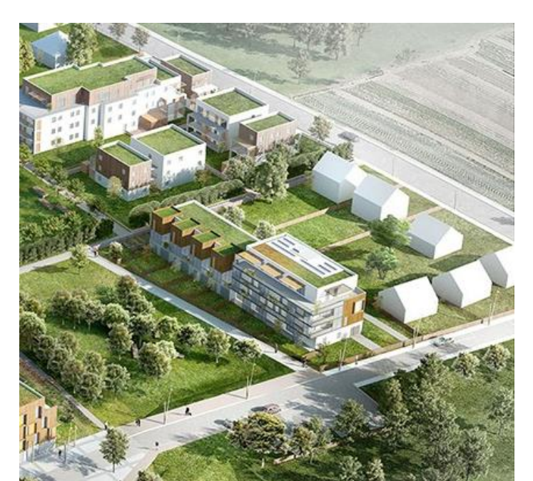
Ecoquartier « Les Meuniers » 2012