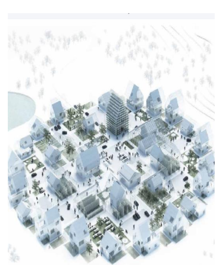
Quartier « ReGen Villages », 2016