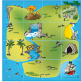
Figure 4 • Tapis de sol quadrillé « L'île au trésor »

robot, quelques minutes sont consacrées à nommer les différents endroits particuliers représentés sur la carte de l'île au trésor.