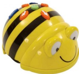
Figure 1 • Bee-Bot avec son interface de manipulation

Le Bee-Bot , illustré à la figure 1, est un robot de sol (ou robot de plancher) programmable en forme d'abeille qui convient pour les enfants dès la maternelle jusque dans les premières années de l'école primaire (Beraza et al. , 2010), (De Michele et al. , 2008), (Komis et Misirli, 2012). Le contrôle des actions se réalise à partir d'une interface tangible qui se situe sur le dos du jouet. Cette interface est constituée de sept boutons qui permettent à l'utilisateur de programmer directement une succession d'instructions simples que le jouet va exécuter de manière séquentielle. Une rétroaction sonore est déclenchée à chaque fois qu'une commande est enregistrée par pression d'un de ces boutons. La mémoire de ce jouet programmable accepte jusqu'à quarante instructions consécutives.