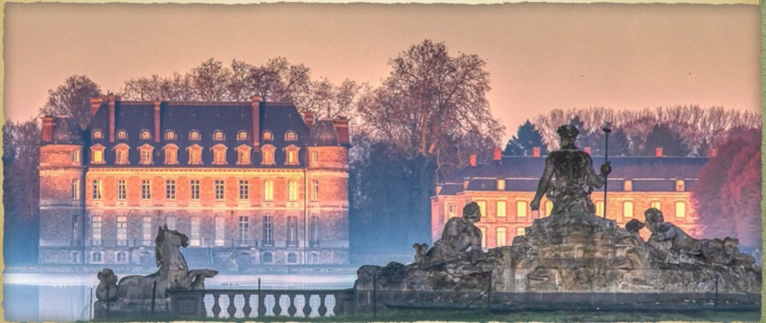
Le château de Beloeil