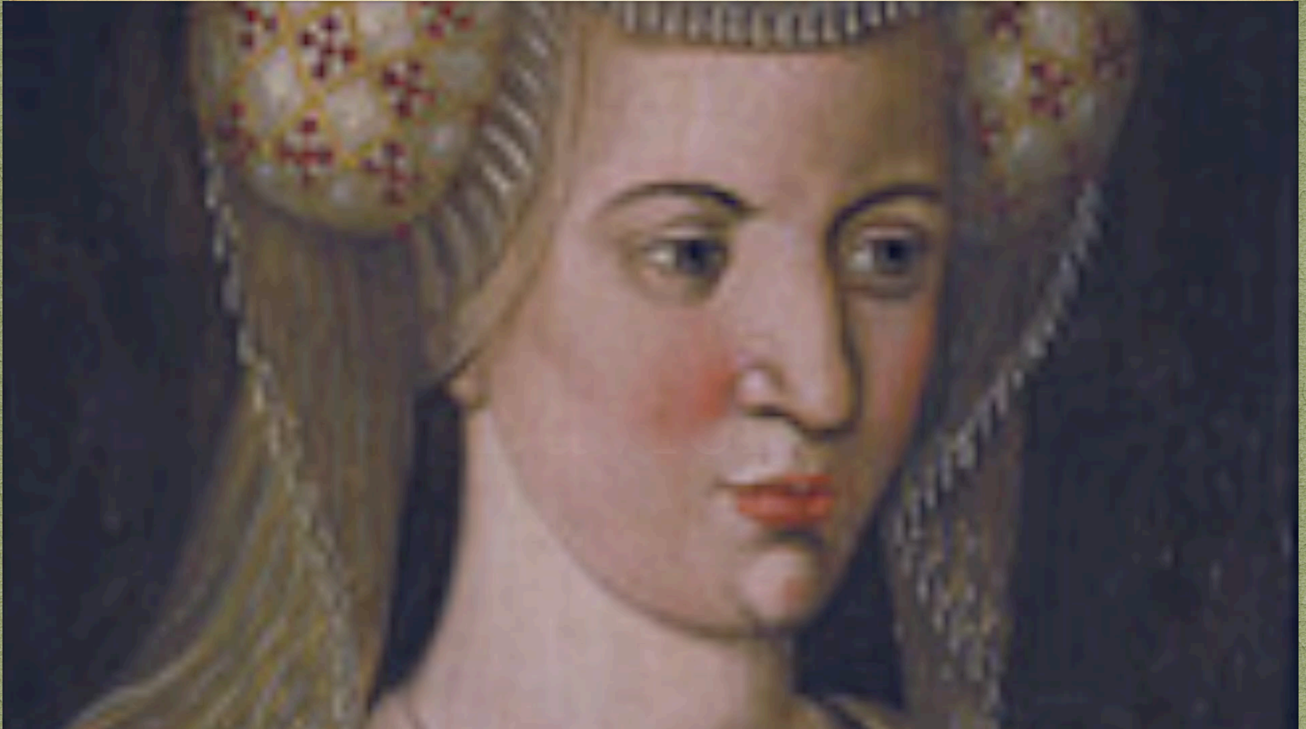
Jacqueline de Bavière