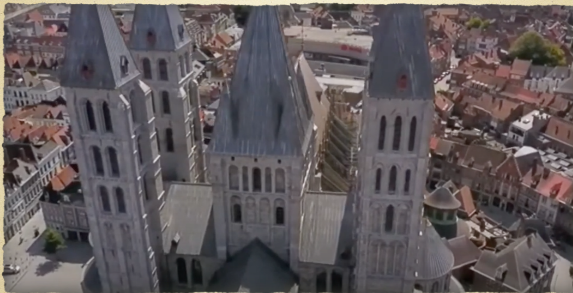
La cathédrale de Tournai