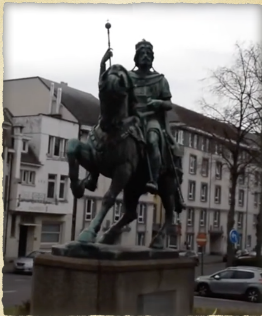
Baudouin de Constantinople