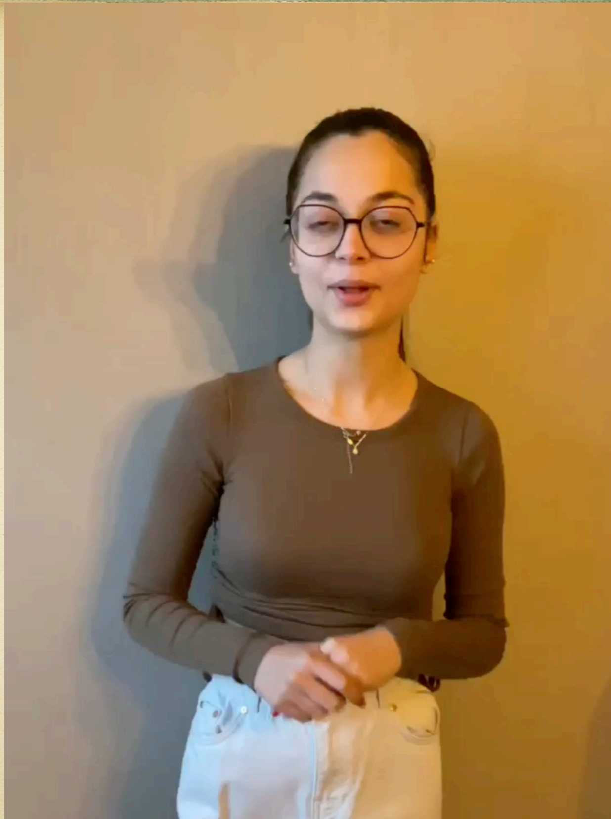
Marie de Hongrie