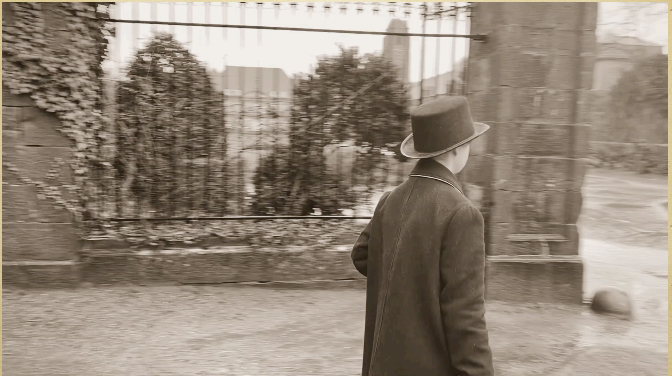
Abbaye de Bonne-Espérance (Binche)