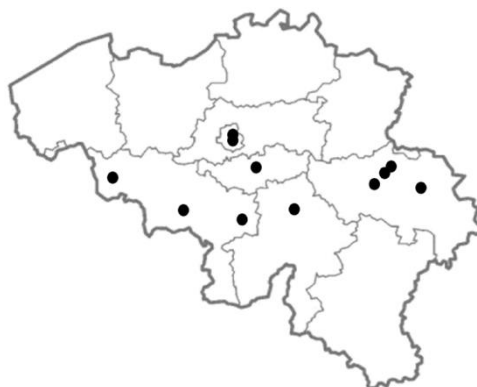
Figure 1. Carte de recensement de l'offre de formations technopédagogiques en Belgique francophone

La présente étude se concentre sur l'évaluation de l'offre de formations technopédagogiques en Belgique francophone, en mettant particulièrement l'accent sur l'analyse de l'offre de formation NUMEFA. La carte, présentée à la figure 1, offre une vue d'ensemble des quelques formations continues disponibles dans ce domaine. Cette cartographie, bien que centrée sur la Belgique francophone, constitue une première étape importante dans la compréhension des opportunités de développement professionnel offertes aux acteurs de l'éducation dans la région.